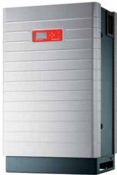
IP 42/ IP 54