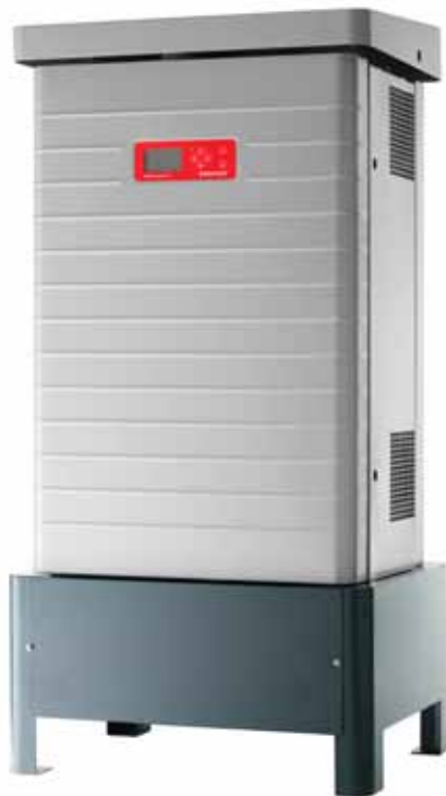
IP 55/ Outdoor